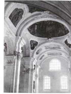
Baum 1. Das Mittelschiff der Kirche nach der glücklich vollendeten Restaurierung