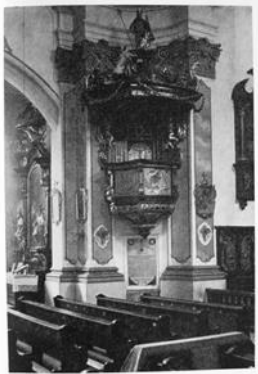
Baum 1. Die Kanzel der Nikolakirche von Joseph Matthias Glitz (1712) in der Pfarrkirche zu Wilsdorf (Untere Bayern, Landkreis [St. Denzel] 1997)

1953 kauften die Deutschordensschwwestern den Nord- und Ostflügel, um ein Mutterhaus für die Gemeinschaft aufzubauen. Das ganze Gebäude erhielt den Namen „Nikola-Kloster“ zurück. Inzwischen bemühten sich vor allem Dr. Bleibrunner, der Heimatpfleger von Niederbayern und das Bischöfliche Ordinariat um die Rettung der Nikolakirche, die in ihrem Baubestand gefährdet war. Im Jahre 1959 überließ der